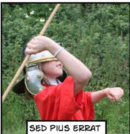
SED PIUS ERRAT