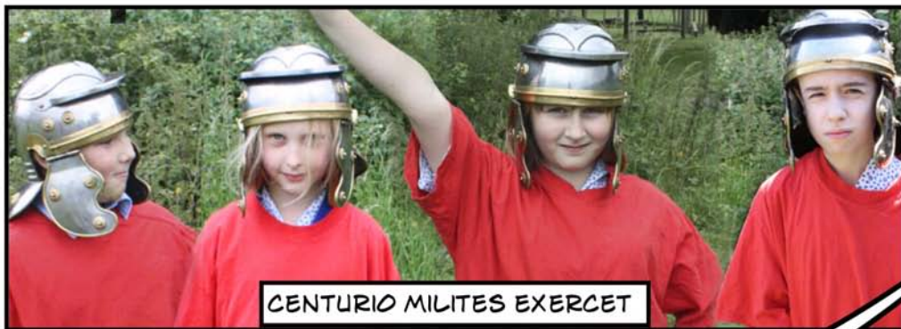
CENTURIO MILITES EXERCET