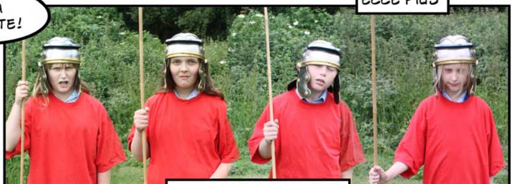
MILITES PILA PORTANT